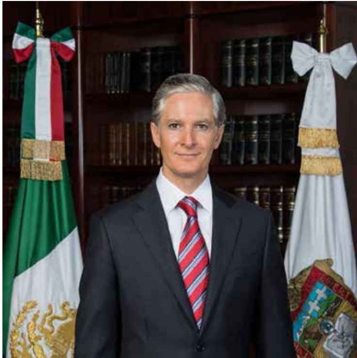
ALFREDO DEL MAZO MAZA GOBERNADOR CONSTITUCIONAL DEL ESTADO DE MÉXICO