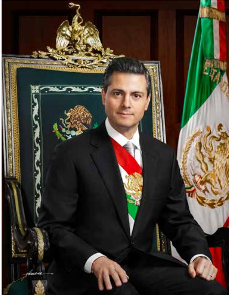
ENRIQUE PEÑA NIETO PRESIDENTE CONSTITUCIONAL DE LOS ESTADOS UNIDOS MEXICANOS