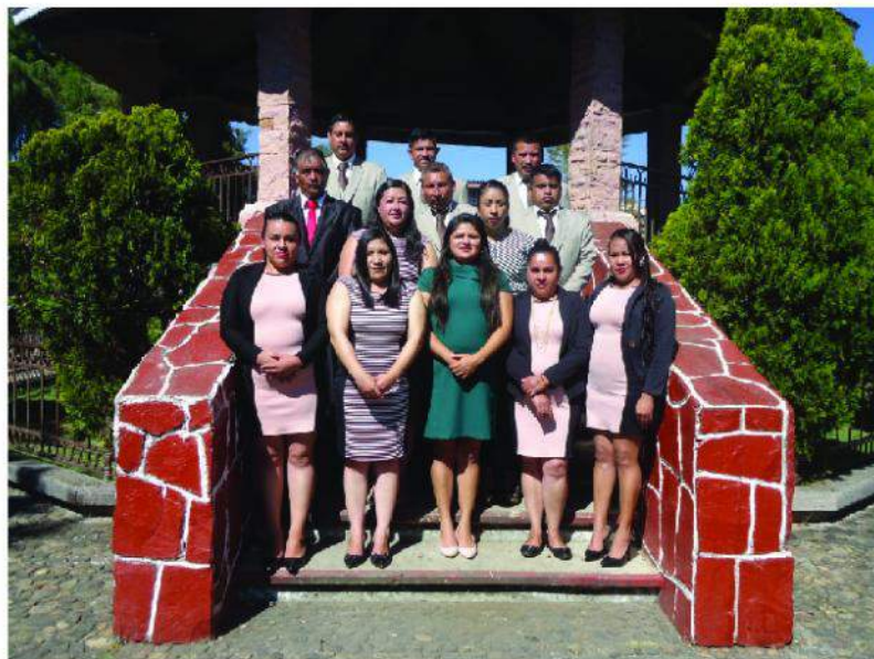
Ayuntamiento Constitucional de San Simón de Guerrero 2019 - 2021