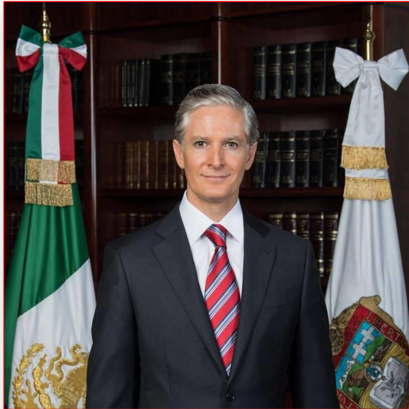
ALFREDO DEL MAZO MAZA GOBERNADOR DEL ESTADO DE MÉXICO 2017-2023