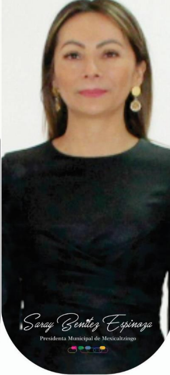
Saray Benítez Espinoza Presidenta Municipal de Mexicaltzingo