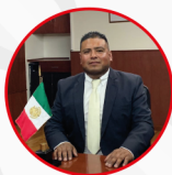
VICTOR RIVERA GARCÍA SÍNDICO MUNICIPAL