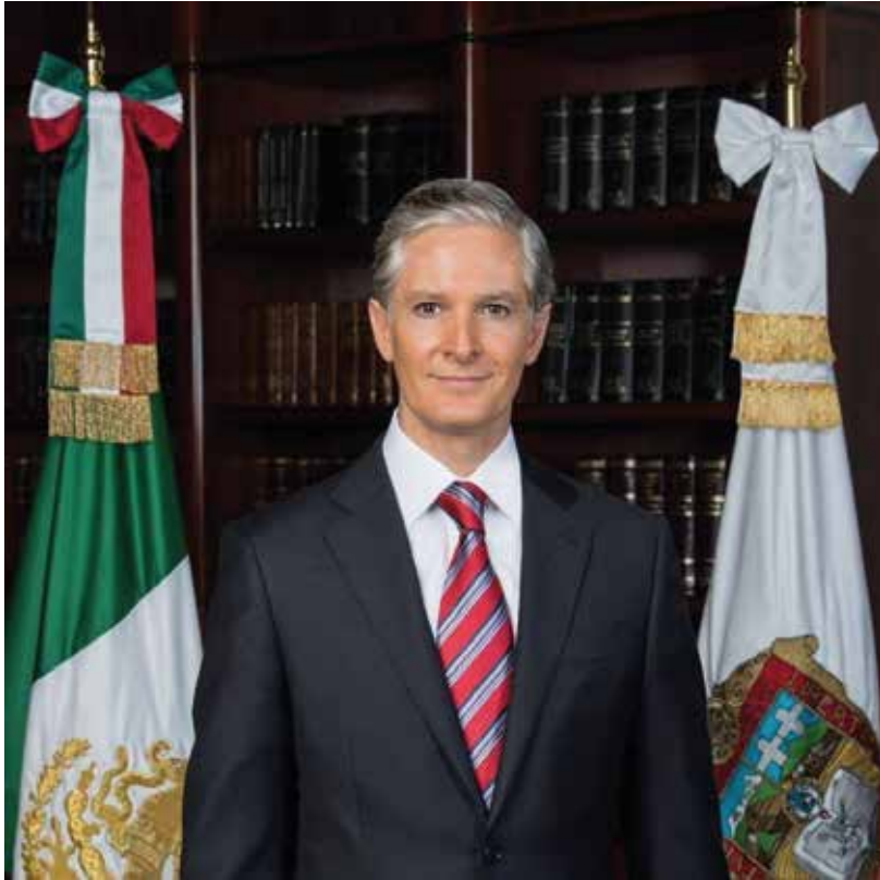
ALFREDO DEL MAZO MAZA GOBERNADOR CONSTITUCIONAL DEL ESTADO DE MÉXICO