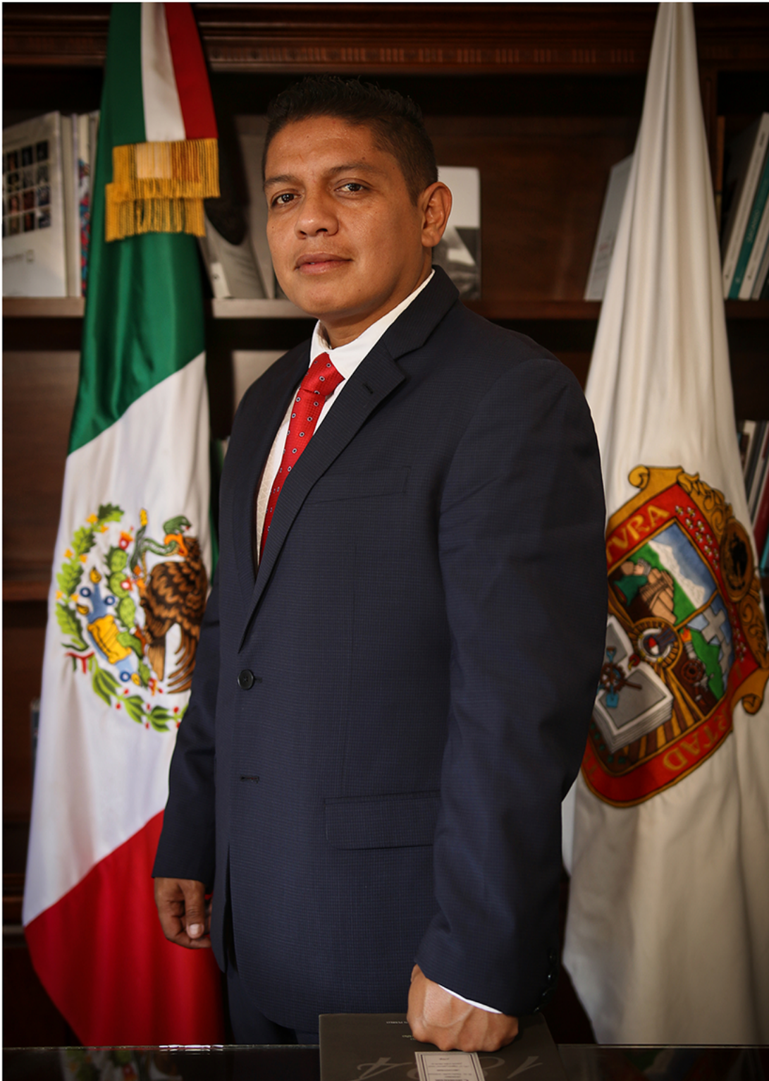
Lic. Leopoldo Domínguez Flores Presidente Municipal Constitucional de Almoloya de Alquisiras