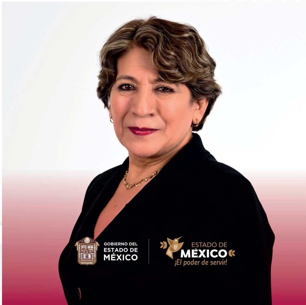
Mtra. Delfina Gómez Álvarez Gobernadora Constitucional del Estado de México