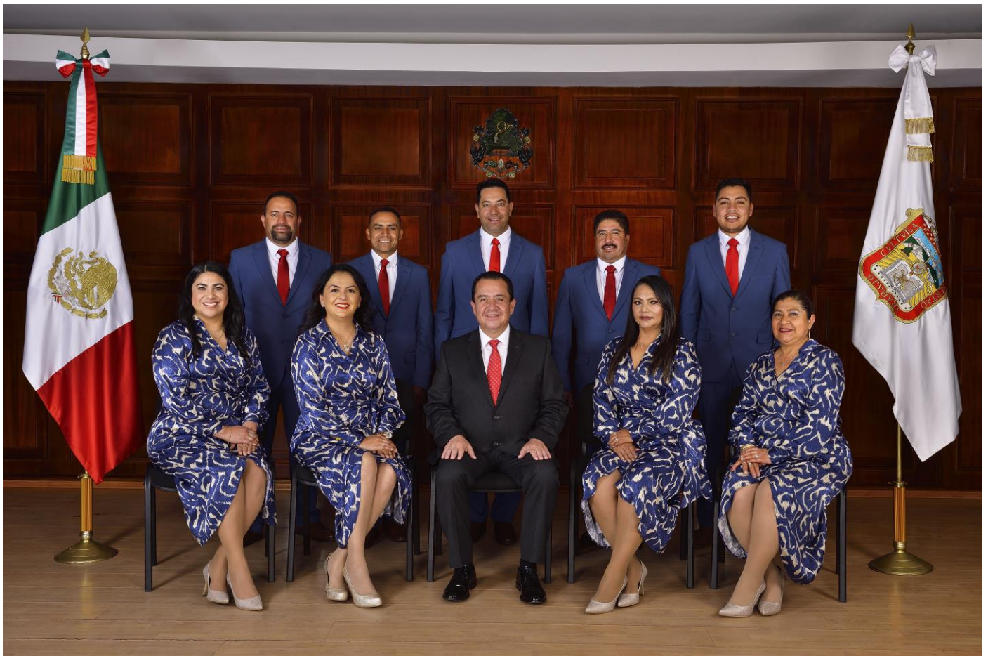
INTEGRANTES DEL CABILDO