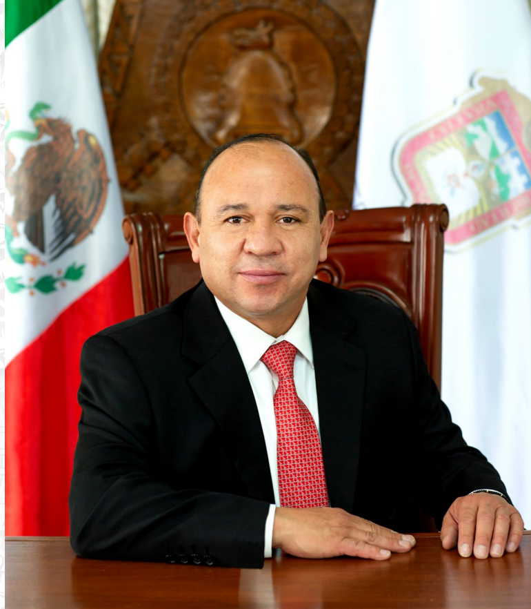
LIC. MANUEL VILCHIS VIVEROS PRESIDENTE MUNICIPAL CONSTITUCIONAL DE ZINACANTEPEC