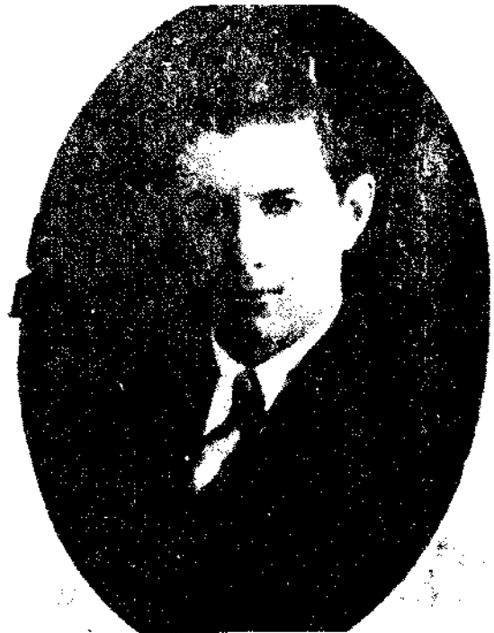
Adolfo López Mateos, cuando fue alumno del Instituto Científico y Literario.