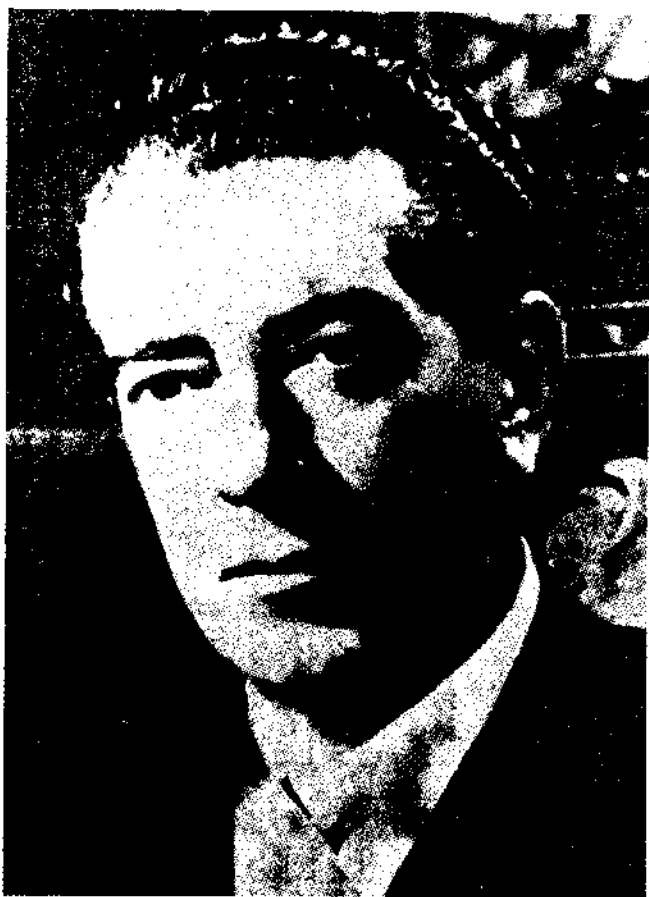
El Lic. Adolfo López Mateos, Presidente Constitucional de los Estados Unidos Mexicanos durante el periodo 1958-1964.