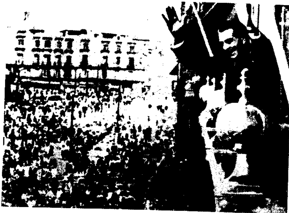
La mexicanización de la industria eléctrica fue recibida con manifestaciones de júbilo popular.