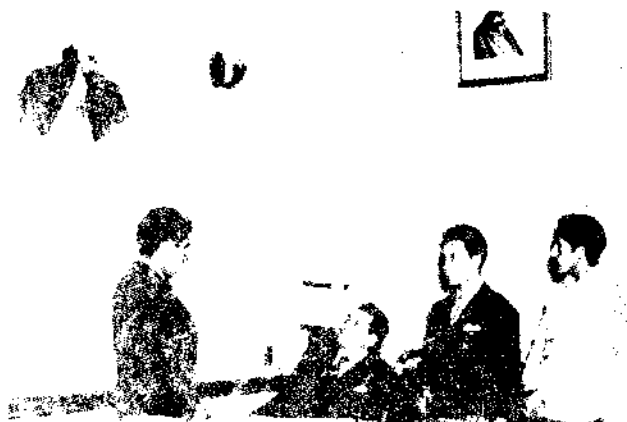
El Lic. Adolfo López Mateos, Director del Instituto Científico y Literario Autónomo del Estado de México. Cargo que desempeñó a partir del 5 de octubre de 1944.