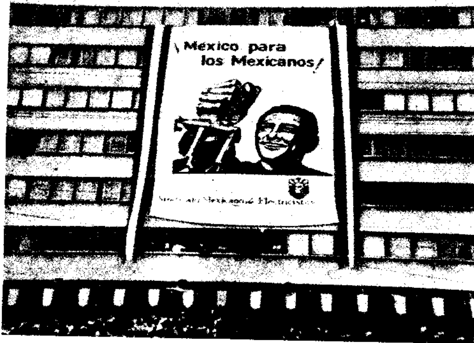
La nacionalización de la industria eléctrica, significó un avance más para la Nación y un gran logro del Presidente López Mateos.