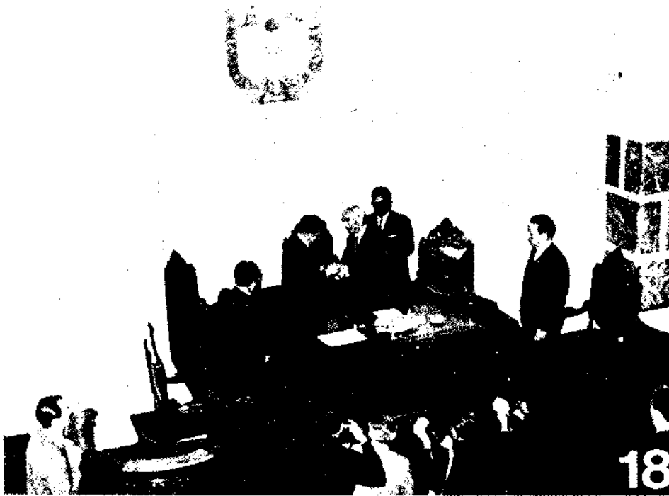
Reconocimiento que el Gobierno del Estado hizo al Lic Adolfo López Mateos.