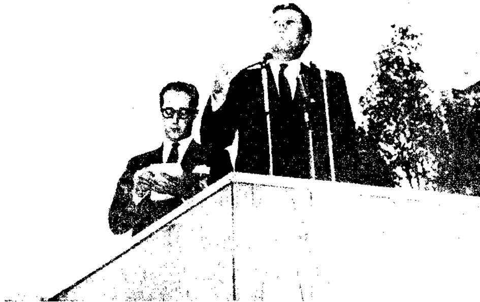
Discurso que el Presidente John K. Kennedy dirigió, durante su visita a nuestro país.

A.H.E.M. / Fototeca / Sección Adolfo López Mateos.