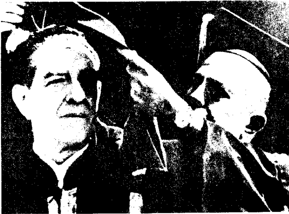
El Lic. Adolfo López Mateos se hizo acreedor a múltiples reconocimientos por su destacada labor durante su gobierno.