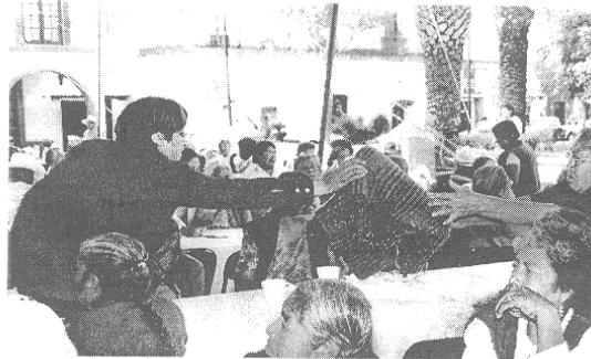
CUADRO DE ADULTOS MAYORES EN EL MUNICIPIO DE TENANGO DEL AIRE

Este proyecto está enfocado a impulsar la cultura de respeto y amor a los adultos mayores, promoviendo que las personas de la tercera edad tengan una participación activa entre la sociedad, haciéndolos sentir útiles, además de brindarles diferentes tipos de servicios como: alimentación, asistencia médica, cursos de manualidades, actividad física, asesoría jurídica, etc., logrando con esto una mejor calidad de vida y un envejecimiento satisfactorio. Actualmente el Sistema DIF Municipal atiende de los 216 adultos mayores del municipio, integrados en 4 clubes, abarcando las 20 comunidades con que cuenta el Municipio. En un 100% son beneficiados con el apoyo de despensa mensual, resultando esto insuficiente para la cantidad de adultos mayores que existen en el Municipio, los cuales se enfrentan día a día a la soledad y el abandono por parte de sus familiares e hijos, situación deprimente que convierte a estas personas en un sector de mayor vulnerabilidad en el Municipio.