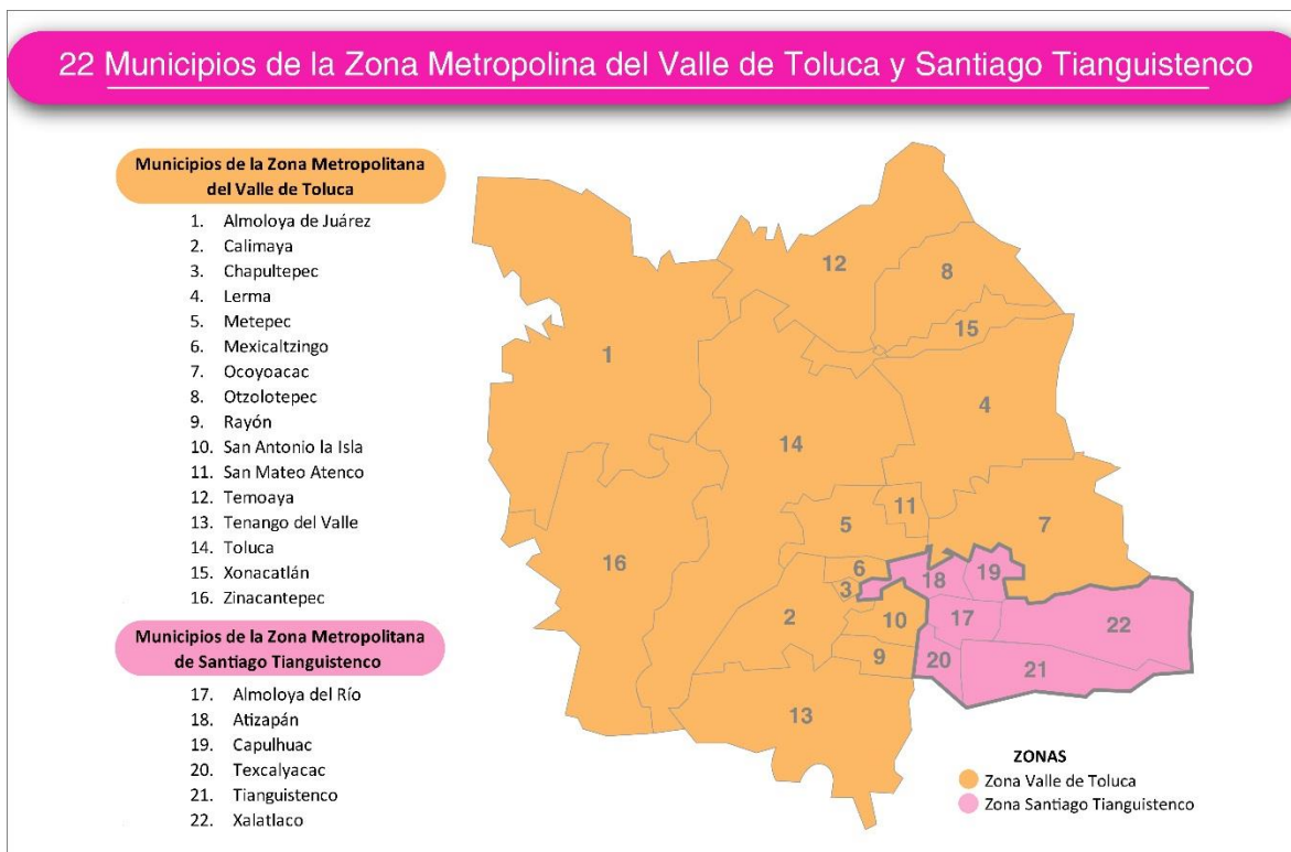
Figura 2. Distribución de la ZMVT Y ZMST