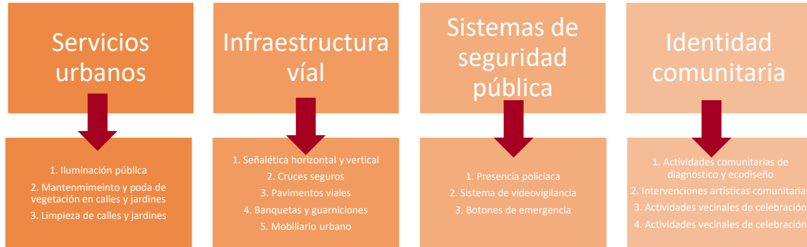
Tabla 9 Líneas mínimas de intervención

A continuación, se describe cada línea de intervención, el elemento específico, el mínimo sugerido, así como la NOM que lo establece y a la que se le dará cumplimiento: